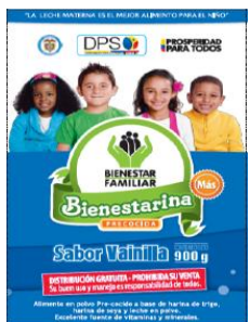
Bienestarina Más® sabor vainilla