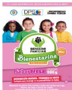
Bienestarina Más® sabor fresa

Complemento alimentario de alto valor nutricional, producido por el ICBF desde 1976.