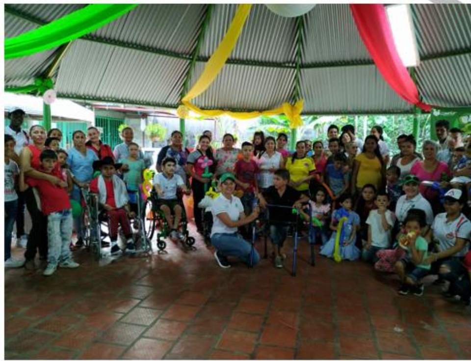
Celebración día de la niñez y la recreación con Hogares Gestores.