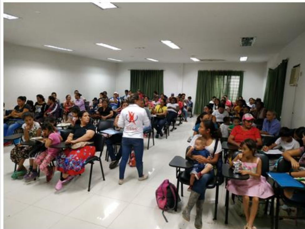
Encuentro mensual de Hogares Gestores en articulación con otras instituciones.