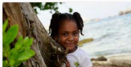
Preguntas y Respuestas Frecuentes