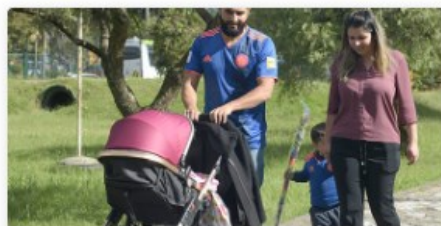
Portafolio de Oferta Institucional