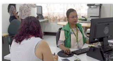
Ventanilla de Trámites y Servicios