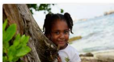
Preguntas y Respuestas Frecuentes