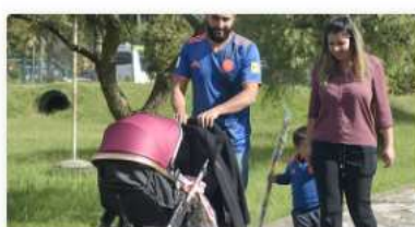
Portafolio de Oferta Institucional