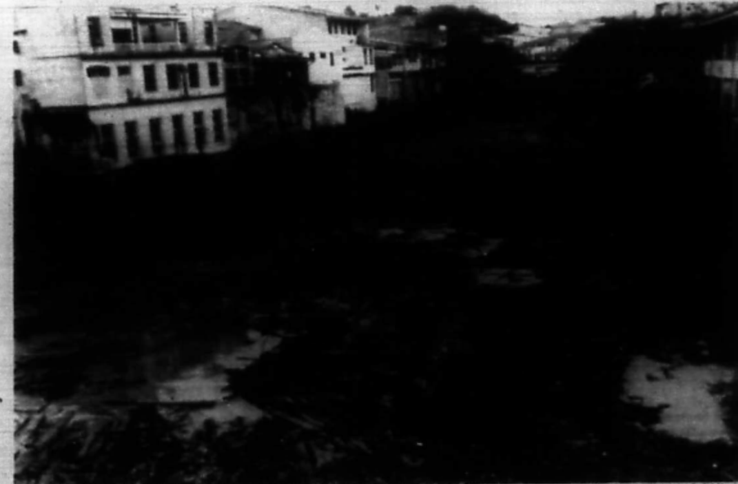
HONDA. — El río Guali ofrece este aspecto a su paso por este puerto fluvial. Toneladas de troncos y desperdicios colman su cauce y ofrecen un panora-

En camiones, bicicletas y motocicletas, familias enteras de la inspección de San Felipe y de la población de Mariquita abandonaron sus residencias.