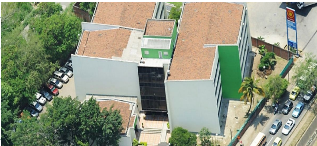
Sede Regional Valle del Cauca Av. 2 Norte No. 33AN – 45 Colombia – Valle del Cauca – Santiago de Cali