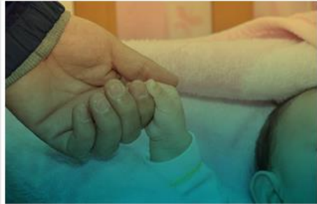
Programa de Adopciones

Acciones institucionales que promueven el restablecimiento de los derechos de niños, niñas, adolescentes, jóvenes, mujeres gestantes, mujeres lactantes cuantos estos han sido vulnerados, amenazados o inobservados basados en el cumplimiento de los principios del interés superior y prevalencia de sus derechos