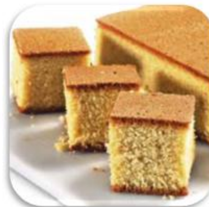
PRODUCTOS DE PASTELERÍA Y REPOSTERÍA