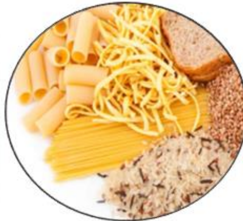
CEREALES Y DERIVADOS