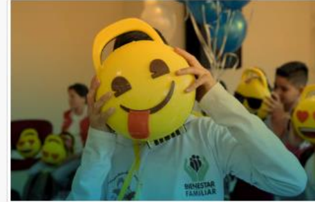
Coordinación de Autoridades Administrativas