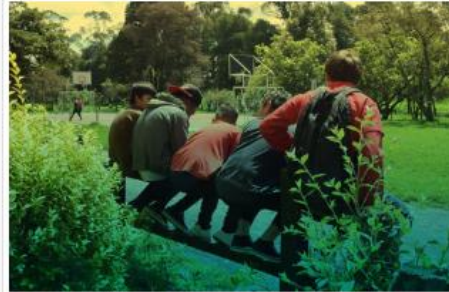
Sistema de Responsabilidad Penal para Adolescentes