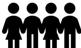
Tabla 9. Niños y niñas de 3 a 5 años