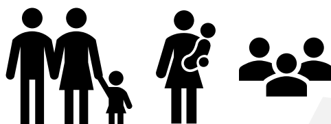
Tabla 11. Familias - Comunidad