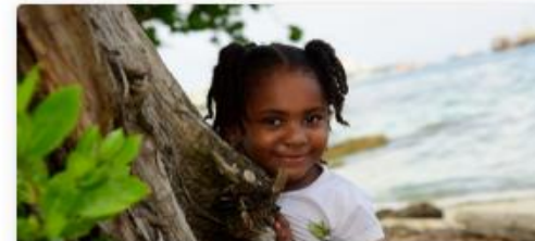
Preguntas y Respuestas Frecuentes