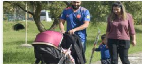
Portafolio de Oferta Institucional