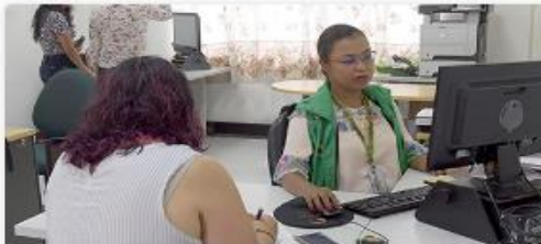
Ventanilla de Trámites y Servicios