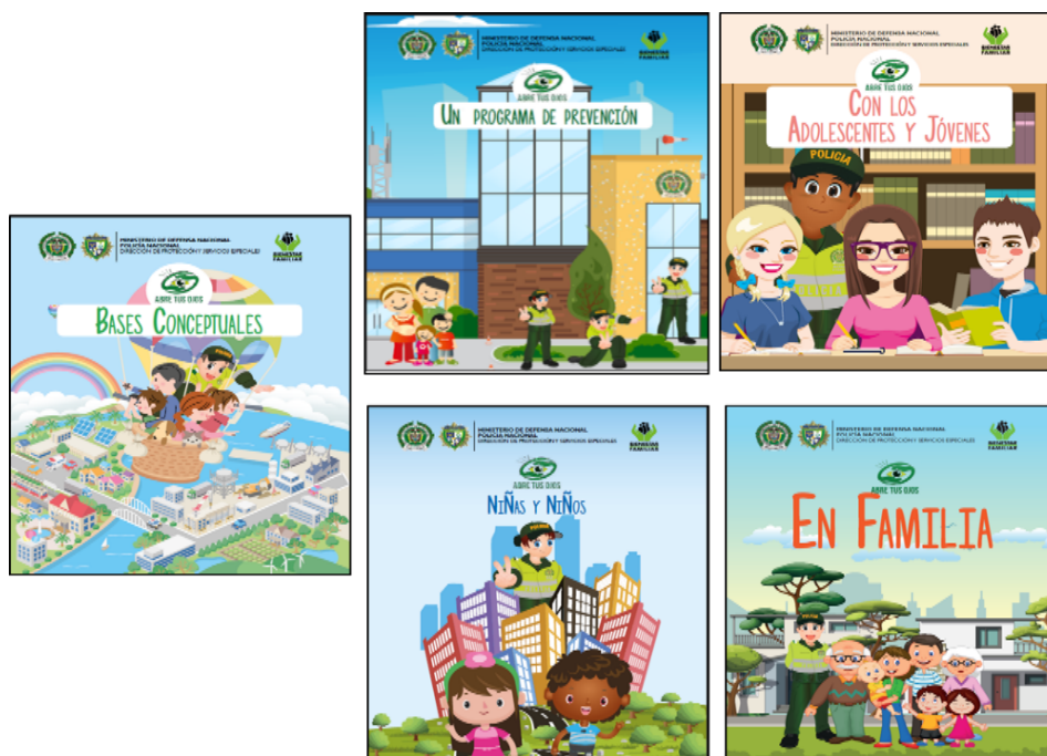
Ilustración 1 - Módulos del programa Abre tus Ojos