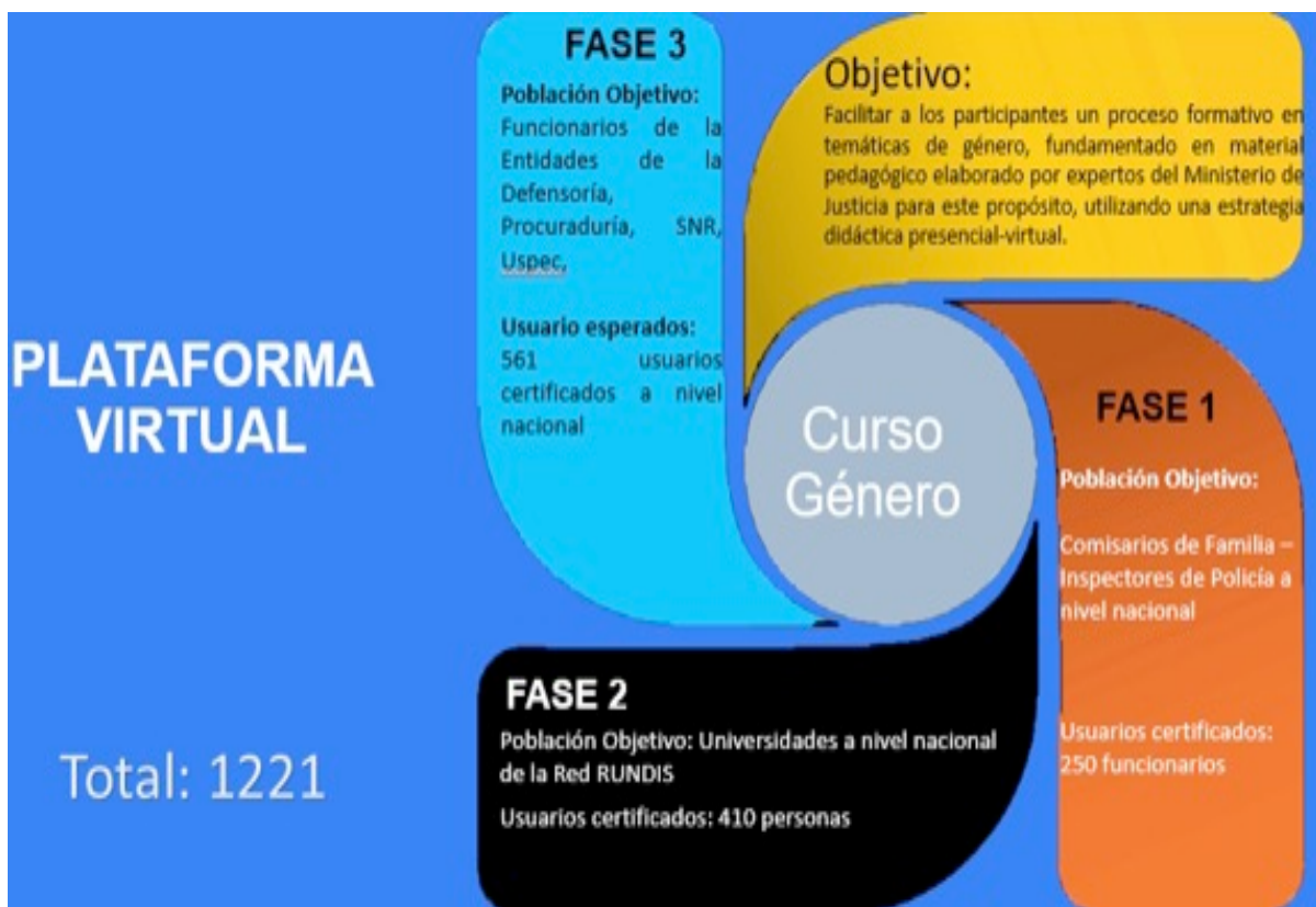
Gráfico 3 – Objetivos y Fases de Cursos de Género