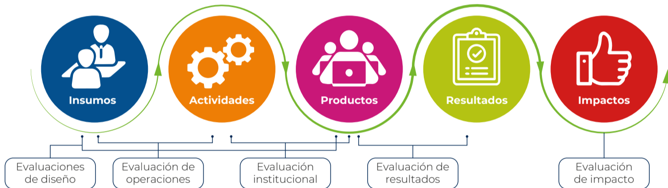
Diagrama 1. Cadena de valor y tipos de evaluaciones