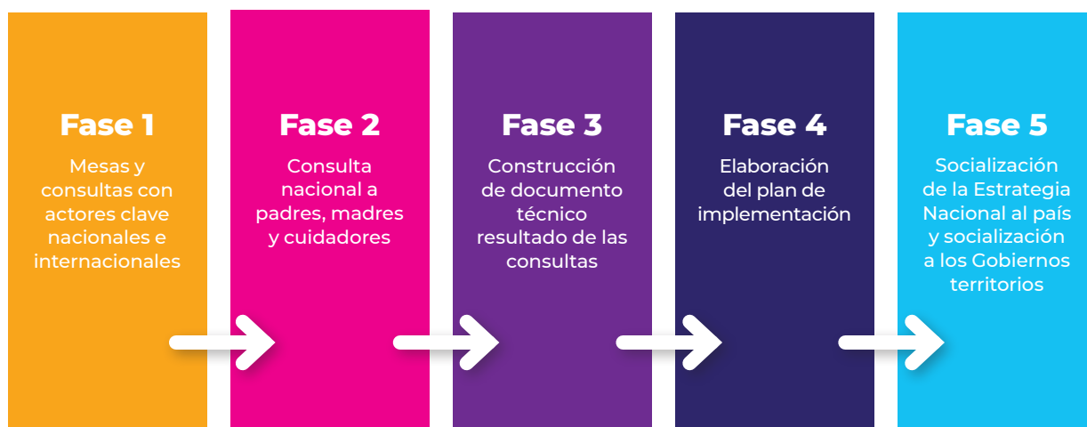
Figura 2. Fases de formulación de la Estrategia Nacional Pedagógica y de prevención del castigo físico, tratos crueles, humillantes o degradantes