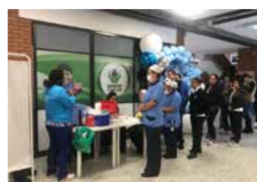
Sede de la Dirección General