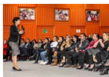
Sede de la Dirección General

Recordemos que el cuidado y la prevención comienza en nosotros y, de esta manera, lograremos trabajar con calidad y transparencia por el desarrollo y la protección integral de la primera infancia, la niñez, la adolescencia y el bienestar de las familias colombianas.