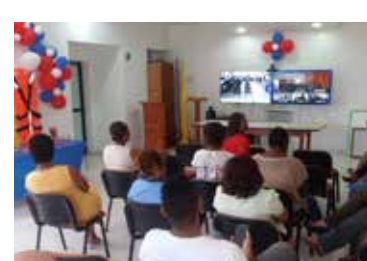
Regional San Andrés