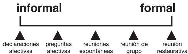
Figura 3: Espectro de Prácticas Restaurativas

A pesar de apoyar las reuniones restaurativas, sería crédulo de mi parte pensar que un solo tipo de intervención restaurativo puede cambiar el comportamiento y el pensar de delinquentes y de jóvenes de alto riesgo que participan en los programas de terapia, educación y residenciales de nuestra agencia. Sin embargo, tenemos la experiencia de cambios positivo significativos en el comportamiento por parte de estos jóvenes cuando participan en nuestros programas. Esto es porque, como dijo Terry O’Connell (el policía que desarrolló los modelos con manual para reuniones restaurativas), cuando visitó una de nuestras escuelas en 1995, “Ustedes están implementando una reunión restaurativa todo el día.” Me ha tomado varios años para apreciar completamente