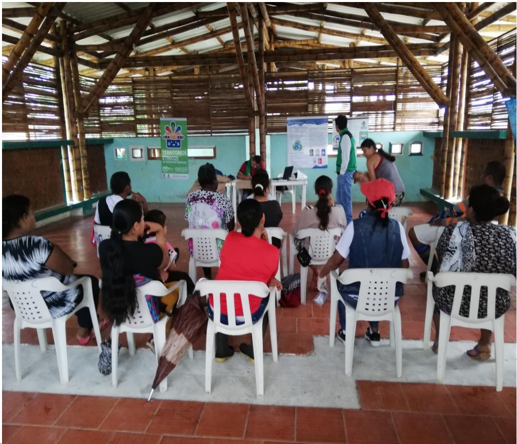
Territorios Étnicos con Bienestar