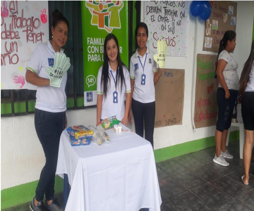
Familias con Bienestar para la Paz