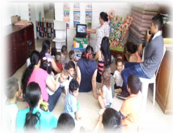
Centro de Desarrollo Infantil Michín Sedes A - B