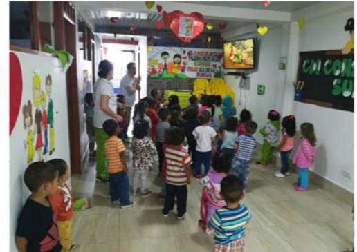
CDI - Construyendo Sueños Belalcazar Sede 2