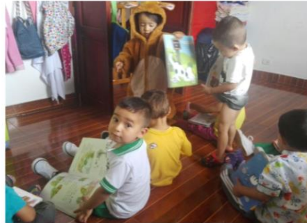
CDI Construyendo Sueños Belalcazar Sede 1