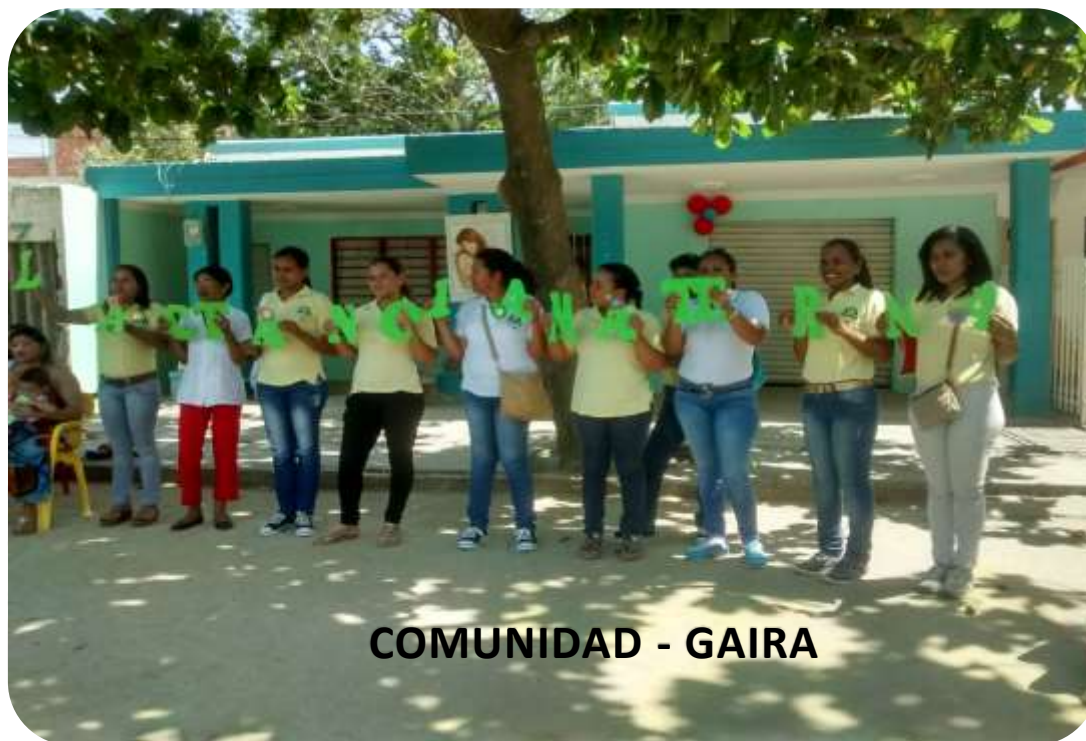
COMUNIDAD - GAIRA