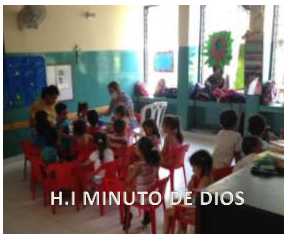
H.I MINUTO DE DIOS