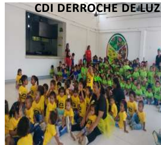
CDI DERROCHE DE LUZ