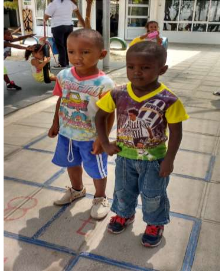
C.D.I Cristo Rey