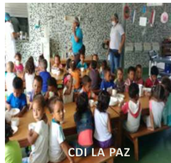
CDI LA PAZ