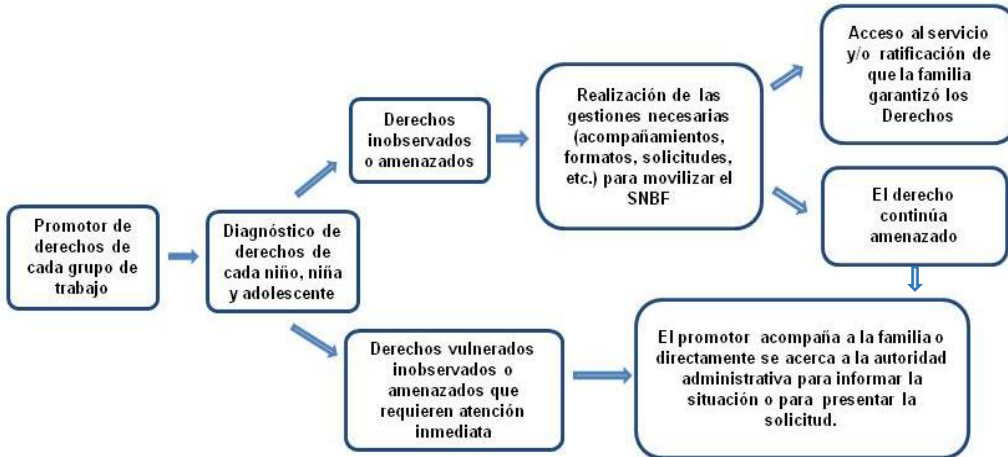
Figura 1. Ruta de gestión interinstitucional y social para la garantía y el restablecimiento de derechos